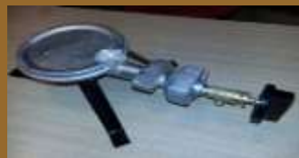
HORNALLA de fundición gris Art 1048