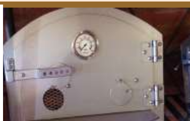
puerta 1002 especial curvada