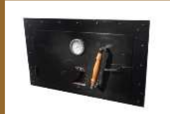
puerta 1004 grai