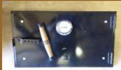
puerta 1004 rectangular