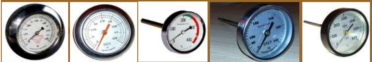
TERMÓMETRO 1022 TERMÓMETRO 1023 TERMÓMETRO 1024/5 TERMÓMETRO 1026 TERMÓMETRO 1027/8/9