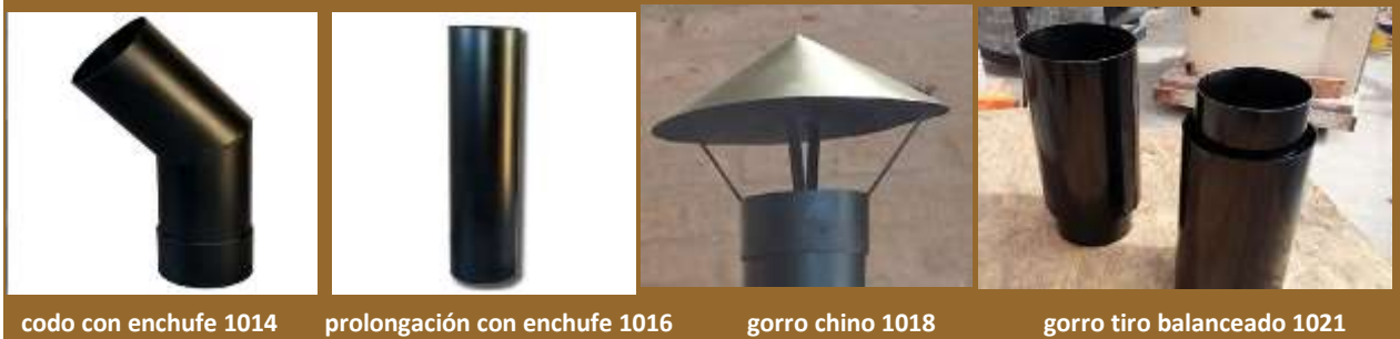
codo con enchufe 1014