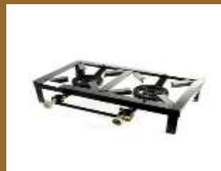
anafe doble hornalla