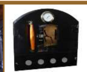
puerta 1003 curvada