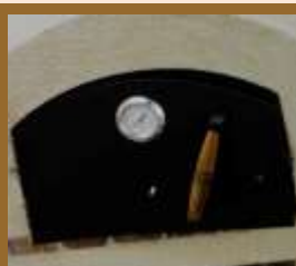
puerta 1000 curvada