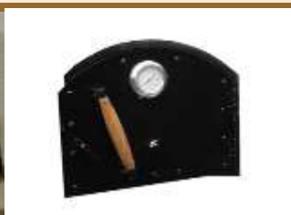
puerta 1001/2 curvada