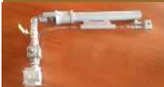
mechero 1044 c/ filtro GAS I