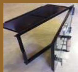
puerta 1004 rectangular