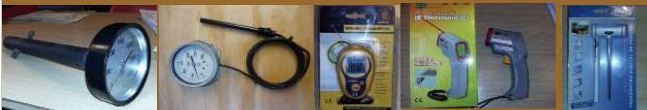
CARCAZAS ROSCABLES CON BULBO A DISTANCIA DIGITAL PUÑO PISTOLA LASER DE PUNCIÓN