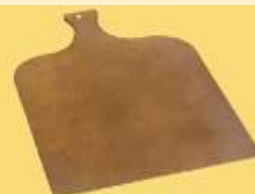
ART 1168 pala de madera chica