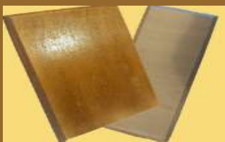
ART 1163 platos de madera