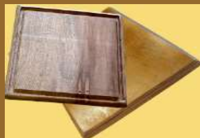
ART 1162 platos de madera