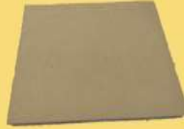
ART 1170 placa refractaria