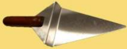
ART 1169 espatula acero pizza