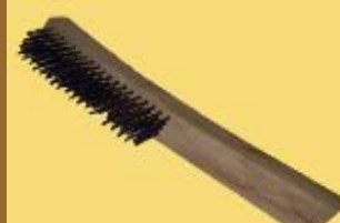
ART 1150 cepillo de alambre