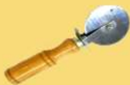
ART 1167 cortapizza