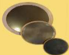
ART 1166 porta-chapa