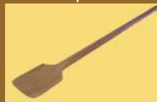
ART 1153 cucharon de madera