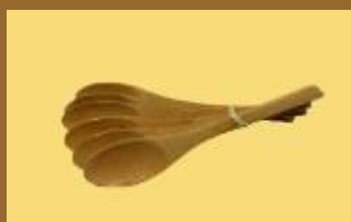
ART 1152 cuchars de madera