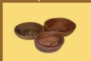
ART 1151 cazuelas de madera