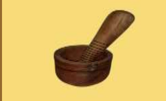
ART 1149 mortero de madera