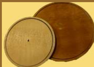
ART 1161 platos de madera