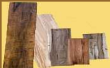
ART 1160 tabla de madera maciza