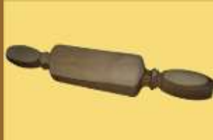
ART 1148 palo de masar