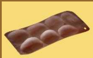
ART 1158 tabla de madera