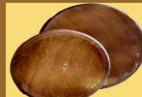
ART 1164 platos de madera