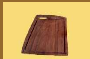
ART 1157 tabla de madera