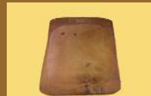
ART 1159 tabla de madera