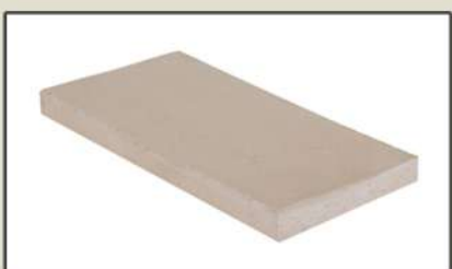
TEJUELAS 15 | 20 | 30